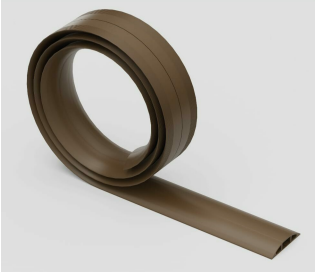
Uncoils To Lay Flat